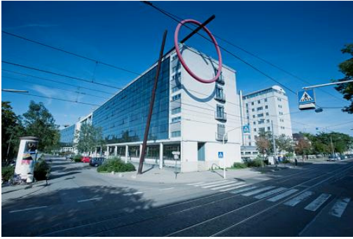
Abbildung: Klinikum der Stadt Ludwigshafen am Rhein gGmbH

Das Klinikum der Stadt Ludwigshafen am Rhein gGmbH ist ein leistungsfähiges, zukunftsorientiertes Krankenhaus der Maximalversorgung mit 939 Planbetten. In 15 Kliniken, 5 Instituten und 12 Zentren versorgen rd. 380 Ärzte und mehr als 1.100 ausgebildete Fach-Pflegekräfte jährlich ca. 38.000 Patienten stationär und rd. 70.000 Patienten ambulant.