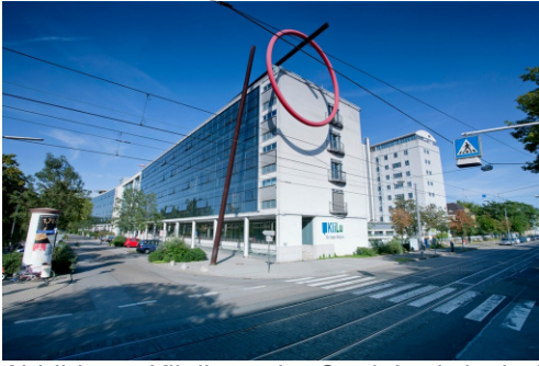
Abbildung: Klinikum der Stadt Ludwigshafen am Rhein gGmbH

Das Klinikum der Stadt Ludwigshafen am Rhein gGmbH ist ein leistungsfähiges, zukunftsorientiertes Krankenhaus der Maximalversorgung mit 939 Planbetten. In 15 Kliniken, 5 Instituten und 13 Zentren versorgen rd. 340 Ärzte und mehr als 700 ausgebildete Fach-Pflegekräfte jährlich ca. 38.000 Patienten stationär und rd. 72.000 Patienten ambulant.